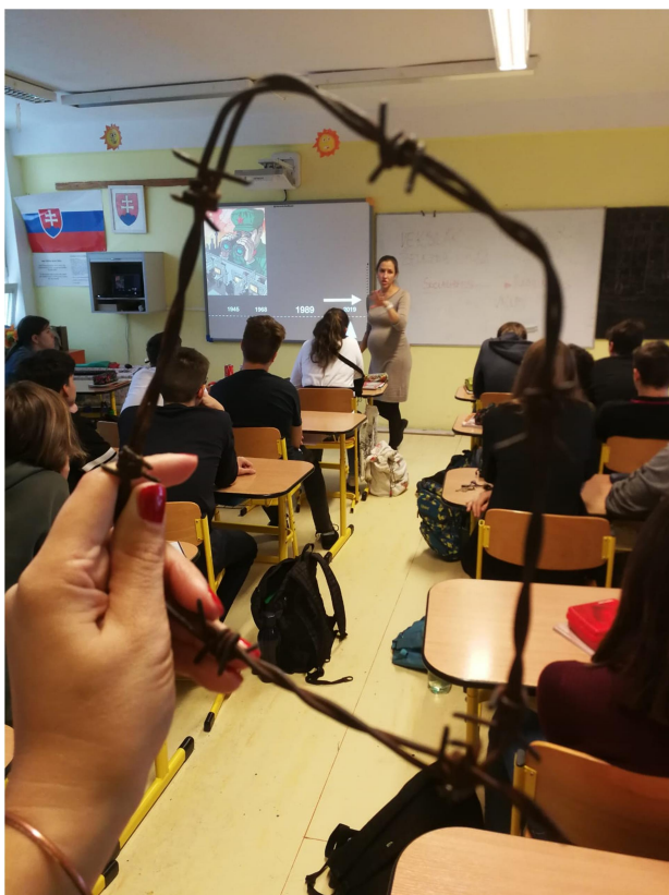
ZŠ Michalovce, 6.11.2019