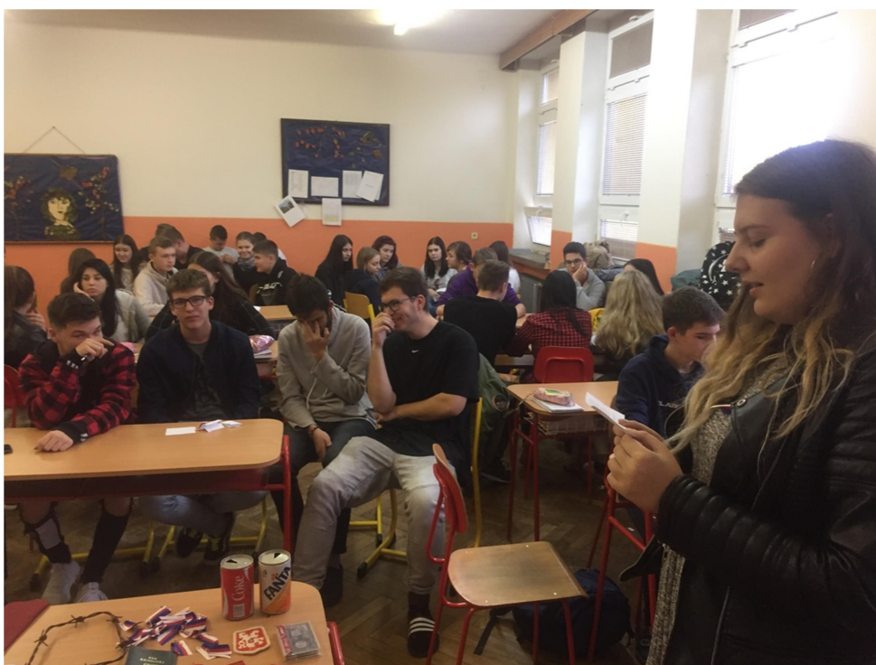
Gymnázium Veľký Krtíš, 4.11.2019