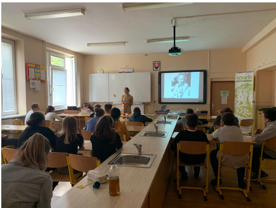
ZŠ Nemšová, 24.9.2019