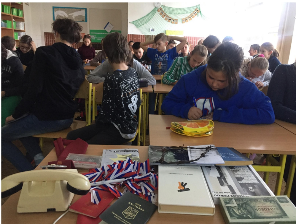
ZŠ Narnia Pezinok, 11.10.2019