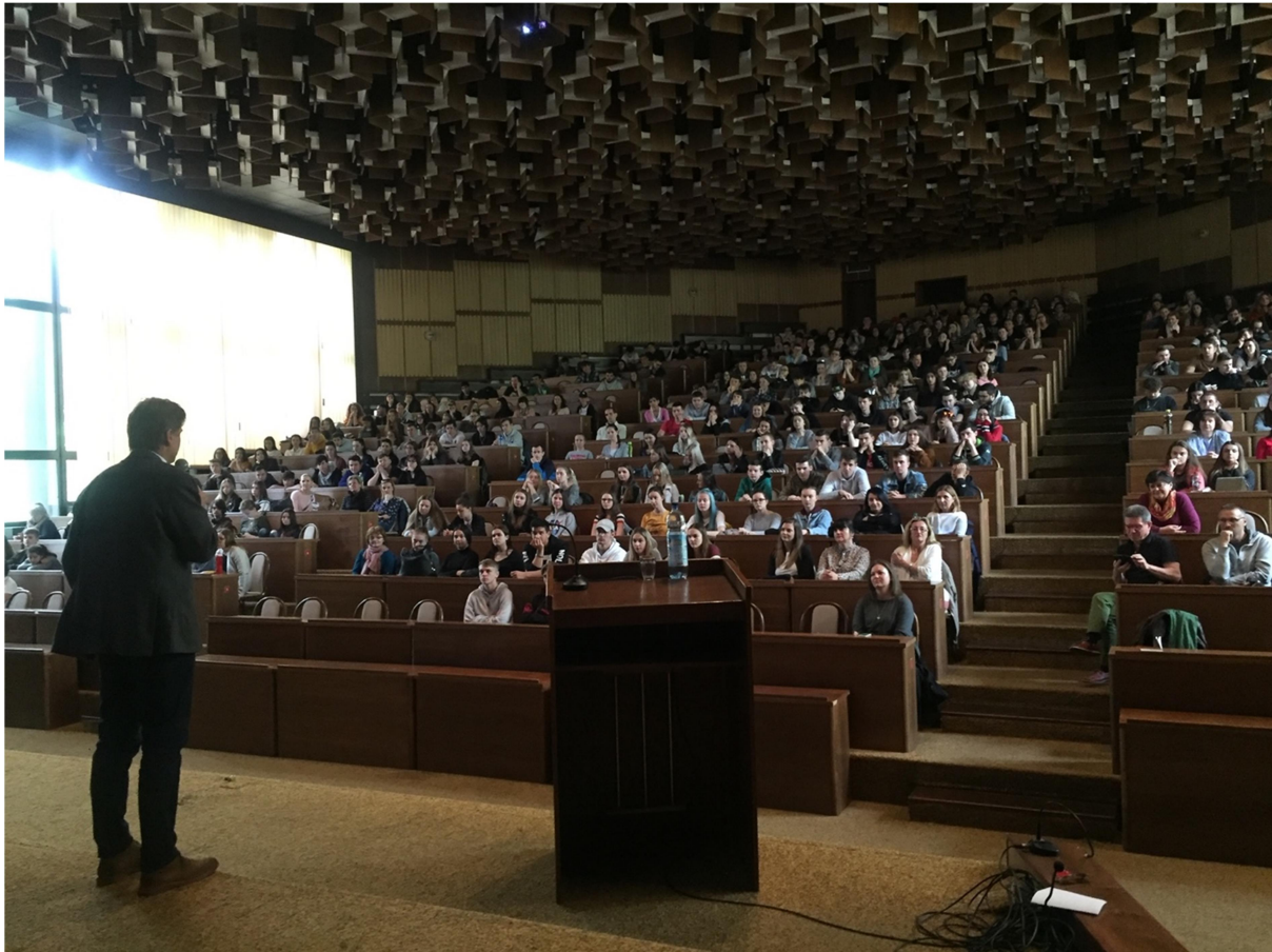
Aula detašovaného pracoviska žilinskej university, Prievidza, 13.5.2019